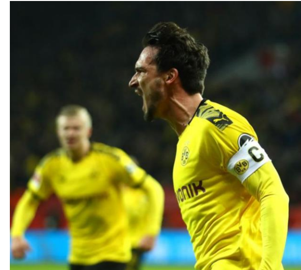
Beim Bundesligaspiel gegen Bayer Leverkusen: Mats Hummels von Borussia Dortmund

Die Fußball-Bundesliga nimmt die Saison am 16. Mai wieder auf. Die DFL will die Bundesliga bis Ende Juni zu Ende bringen - womöglich dürfen die Klubs künftig mit fünf Auswechslungen planen. Zudem wurden die Ergebnisse der zweiten Covid-19-Testwelle bekannt.